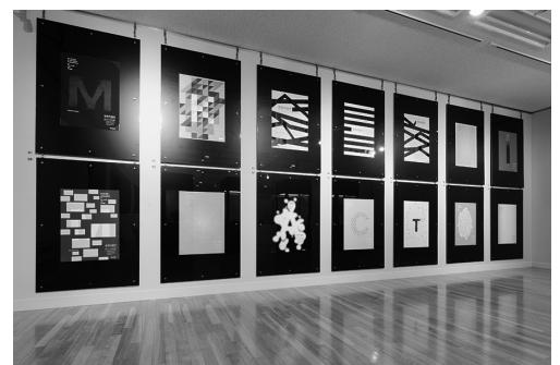
平成25年度展示風景