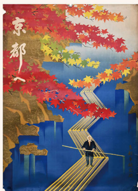
1. 西澤弥一郎《京都へ》 1937年 釘菱弥蔵

本展では、釘菱弥コレクションのなかから、昭和前期に西澤が手がけた京都市の観光ポスターや戦後手がけたさまざまな広告、沖縄県章をはじめとするシンボルマークの制作など、西澤の活動の一端を紹介します。くわえて、当館が所蔵する同時期に制作された福永俊吉による《京都へ》も披露します。