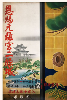
3. 西澤弥一郎《恩賜元離宮二條城》 戦前 釘菱弥蔵