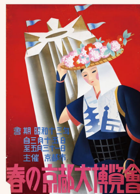
4. 西澤弥一郎《春の京都大博覧会(原画)》 1938年 釘菱弥蔵