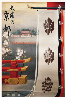
2. 西澤弥一郎《史蹟の京都》 1940年 釘菱弥蔵