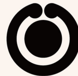
6. 西澤弥一郎《塩竈市章》 1942年