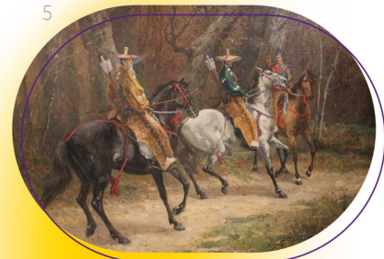
1. 名和昆虫研究所 生物標本蝶類 1911以前 AN.2166 / 2. 島津製作所 蒸気汽鐘裁断模型 1907以前 AN.2111 / 3. ビエール・ボナール 『ラル・ヴ・ブランシュ』誌部分 1894 AN.4622 / 4. ティファニー・ガラス花瓶 19C末~20C初 AN.1195 / 5. 浅井忠 武士山狩図部分 1905 AN.3279