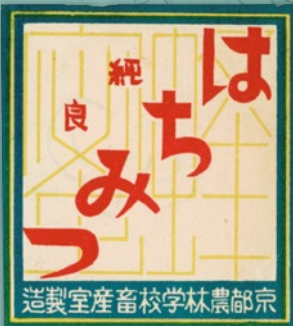
農産物ラベル(1935年頃・京都府立大学蔵)