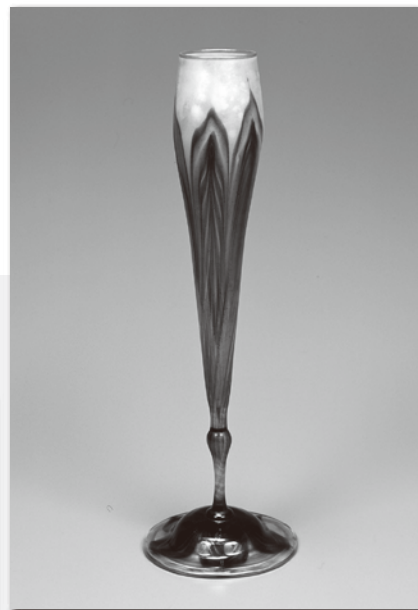
植物模様花瓶 (レイス・C.ティファニー・作、 京都工芸繊維大学美術工芸資料館蔵・AN.1203)