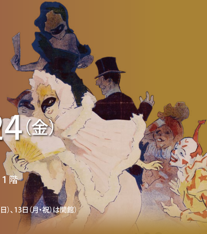
ポスター「オペラ劇場1894年度謝肉祭第2回仮面舞踏会」(ジュール・シェレ・画、京都工芸繊維大学美術工芸資料館蔵・AN.3353)