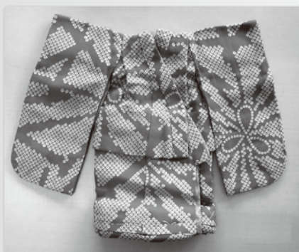
比翼仕立長着雛形(1950年頃、個人蔵)

本展覧会では、各大学が所蔵する歴史資料や工芸品、教員や学生が収集した貴重なコレクション、授業用の教材など約100点の展示を通して、三大学の個性豊かな歴史と特色を紹介します。