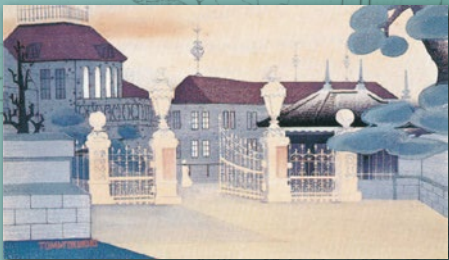
版画「白イ門」(徳力富吉郎・画、京都府立医科大学蔵)