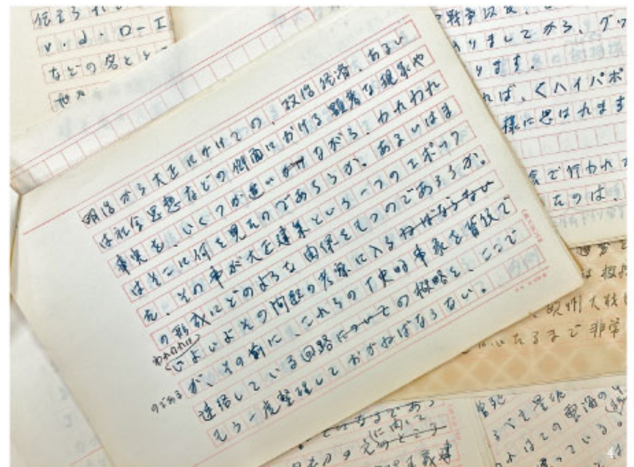
1. 長谷川堯が撮影した唐津の風景 2. 長谷川堯が撮影した村野藤吾作品(関西大学)のポジフィルム 3. 長谷川堯に宛てた村野藤吾の書簡 4. 長谷川堯の自筆原稿 [すべて長谷川家蔵]