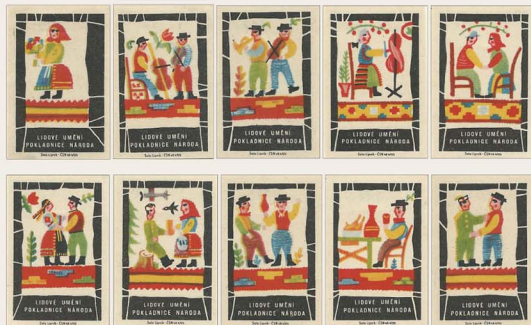
マッチラベル《民俗芸術》 1963年（個人蔵）