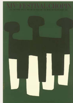
ヤロスラフ・スーラ 《第14回ショパン・フェスティバル 1973 (フランス語版)》 1973年 (AN.5765-38)