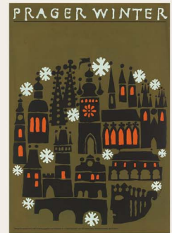
ヤロスラフ・スーラ 《プラハの冬 (ドイツ語版)》 1984年 (AN.5765-41)