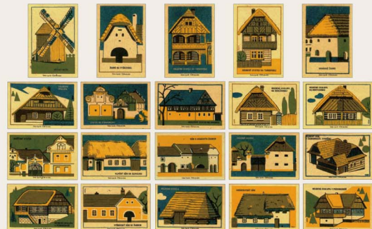
マッチラベル《伝統的な建築》 1961年（個人蔵）